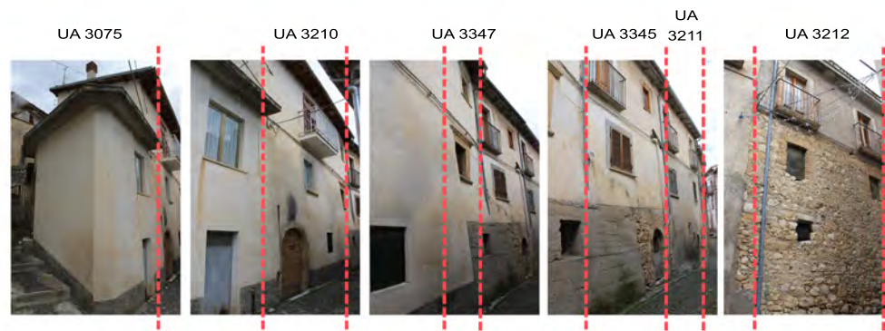
Via San Tussio