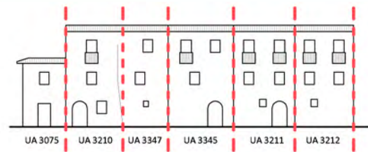
Via San Tussio